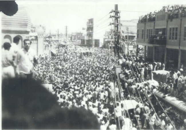
مظاهرة في بغداد بعد ثورة تموز

لقد استطاع الرفيق سلام عادل ان يثبت في الحزب تقاليد مواجهة الظروف الصعبة والأزمات برص الحزب أولاً وتوحيده، فكرياً. فكان كلما ادلهمت الحطوب، يقوم بعقد الاجتماعات الحزبية الموسعة لكوادر الحزب من أجل توحيد وجهة نظر الحزب ورص كوادره حول سياسة واضحة موحدة.